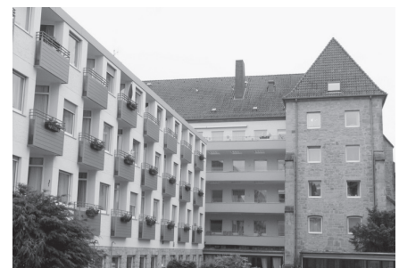
Ansicht vom Garten aus (links der Anbau)