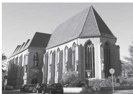
Straßenansicht (Ecke Neue Straße/Brühl)